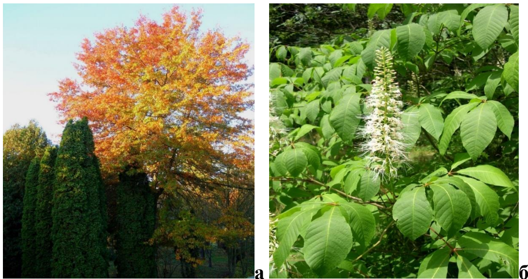
Рис. 4. Дуб болотний в осінній період (а) та гіркокаштан дрібноквітковий під час цвітіння (б)

Значна кількість деревних, чагарникових видів і ліаноподібних є перспективними для використання у садово-парковому господарстві (рис. 4).