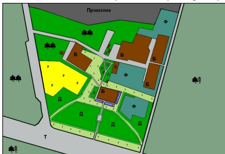
Рис. 1. Карта-схема території Поліського філіалу УкрНДІЛГА

Згідно проектних даних, дендрологічний парк Поліського філіалу УкрНДІЛГА (попередня назва – Поліська агролісомеліоративна науково-дослідна станція) знаходиться на території у зеленій зоні м. Житомир на відстані 1 км (нині – 200 м) від межі міста у західному напрямку (рис. 1).